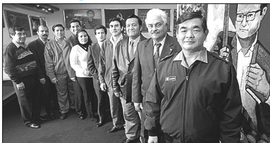
Histórico Grupo Especial de Inteligencia (GEIN), al mando del general PNP Antonio Ketín Vidal.

La investigación criminal permite a las autoridades judiciales administrar la justicia con base en la confirmación científica, recolección, evaluación y análisis de la información, cuya finalidad es producir conocimiento útil para la toma de decisiones. Es una de las especialidades más importantes del trabajo policial, dado que implica un proceso metodológico, técnico y científico para encontrar indicios y luego evidencias.